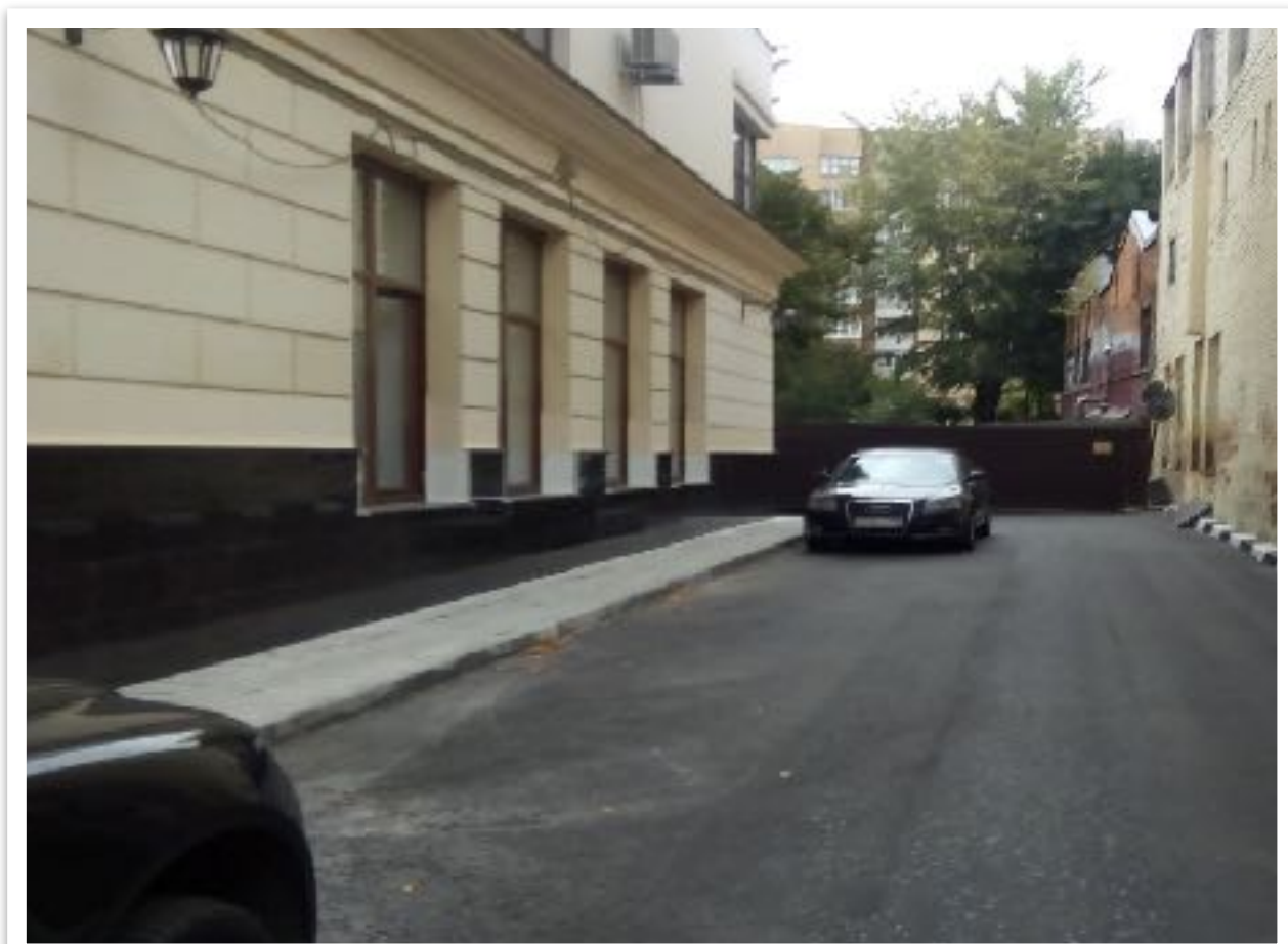
Николопесковский Б. пер. 12